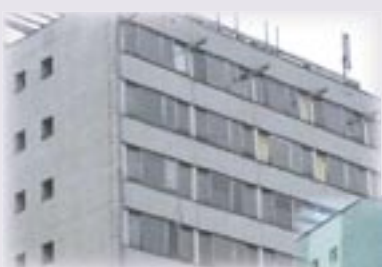
Revitalizace výškového domu

Bosonožské náměstí 1/2 642 00 Brno-Bosonohy Telefon: 547 227 771 Fax: 547 227 771 E-mail: info@veselyds.cz