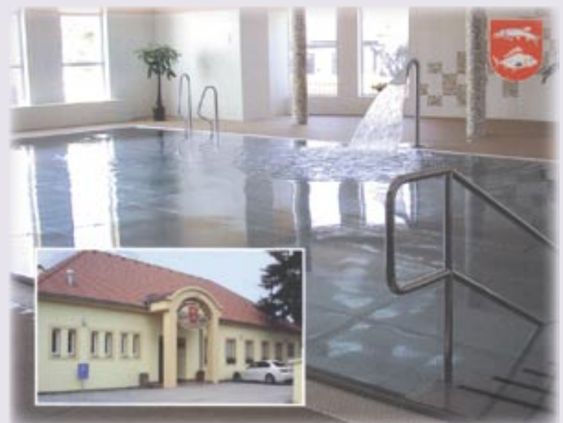
Bazén v Hrušovanech nad Jevišovkou