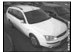
Ford Mondeo 2,0 TDCI r.v. 2001, cena 225.000 Kč kombi, klima, 8x airbag, ABS, orig. rádio, posil., střešní nosič, tažné, centrá dálk., tón. skla, el. zrcátka