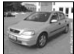
Opel Astra 1,7 TD klima r.v. 2000, cena 179.000 Kč klima, airbag řidiče, ABS, orig. rádio, imobil., el. okna, posil., centrá dálk., tón. skla, otáčk., vyhř. el. zrcátka