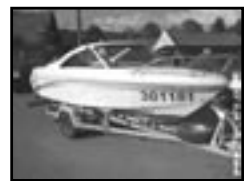
Lod' Milenium 485 75 PS r.v. 2001, cena 299.000 Kč benzín, stav velmi dobrý, Cene včetně vozuku. MOTOR SELVA 75 PS.

telefon a fax: 546 452 948 mobil: 602 526 745 606 385 292, 602 536 741 e-mail: avtom@volny.cz www.avautobazar.cz