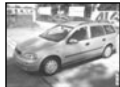
Opel Astra combi 1,7 TD r.v. 1999, cena 169.000 Kč klima, 2x airbag, ABS, rádio, centrá, el. př. okna, stf. nosič, tón. skla, otáčk., venk. tepl.