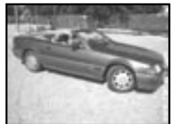
Mercedes-Benz SL 320 r.v. 1996, cena 399.000 Kč aut. klima, a přev., 2x airbag, ASR, ABS, kúže, CD, alarm, el. př. okna, shm. střecha, posil., alu kola