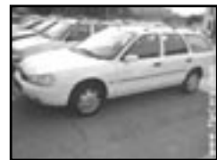
Ford Mondeo combi 1,8 r.v. 1999, cena 85.000 Kč klima, 2x airbag, ABS, centrá, el. okna, posil., střešní nosič, alu kola, el. seřid. vyhř. sed., el. zrc.