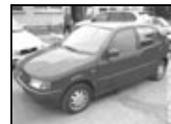
VW Polo 1,9 diesel r.v. 1996, cena 85.000 Kč 47 kW, nafta, 2 majitel., nehavarované, centrá, el. okna, posilovač řízení