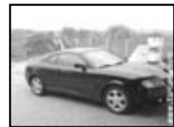
Hyundai Coupé 2,0i r.v. 2005, cena 379.000 Kč klima, ABS, orig. rádio, el. př. okna, posil., alu kola, centrá dálk., tón. skla, el. zrcátka, venk. teploměr