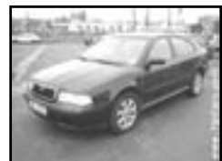
Škoda Octavia 1,8 20V r.v. 2000, cena 189.000 Kč aut. klima a přev., 4x airbag, ABS, kúže, el. okna, střešní šibr el., posil., poč., alu kola, tempomat