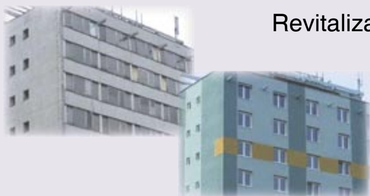
Revitalizace výškového domu

Bosonožské náměstí 1/2 642 00 Brno-Bosonohy Telefon: 547 227 771 Fax: 547 227 771 E-mail: info@veselyds.cz