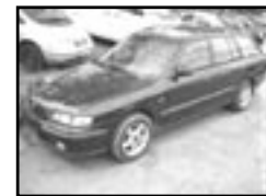
Mazda 626 2,0 DITD r.v. 1999, cena 160.000 Kč kombi, nafta, +4ziminí kola, klima, 4x airbag, ABS, rádio, centrá, imobil., el. okna, posil., alu kola