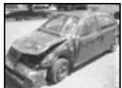
Škoda Fabia 1,4 16V hav. r.v. 2003, cena 75.000 Kč AIRBAGY JSOU OK I, klima, 2x airbag, centrá, imobilizér, el. př. okna, otáčk., zámek řídicí páky