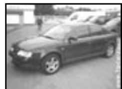
Audi A6 2,5 TDI r.v. 1998, cena 225.000 Kč aut. klima, a převod., 4x airbag, xenony, ABS, alarm, el. okna, stf. šibr el., alu kola, tažné, temp.