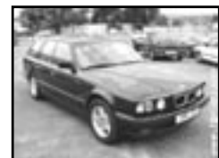
BMW 525 TDS klima r.v. 1995, cena 149.000 Kč klima, 2x airbag, xenony, ABS, kúže, CD, el. př. okna, posil., počítač, alu kola, vyhř. sed., dřevu, tón. skla