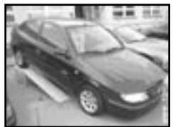
Citroen Xsara 1,8i r.v. 2001, cena 25.000 Kč 5 míst, tmavě modrá metalíza, klima, el. okna, alu kola, centrá dálkový, el. zrcátka