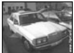
Mercedes-Benz 123 200D r.v. 1970, cena 230.000 Kč obsah 2 197 cm, 44 kW, nafta, stav dobrý, střešní šibr man., tažné zařízení