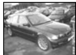
BMW 330 D r.v. 2000, cena 316.000 Kč aut. klima, 6x airbag, ABS, posil., alu kola, centrá dálkový, tón. skla, otáčkoměr, el. zrcátka