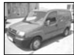
Fiat Doblo 1,9 D r.v. 2001, cena 175.000 Kč Po velkém servisu, airbag řidiče, CD, centrá, el. př. okna, posil., tažné, otáčk., el. zrcátka