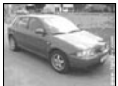
Audi A3 1,9 TDI r.v. 2001, cena 299.000 Kč aut. klima, 2x airbag, xenony, ABS, alarm, el. okna, posilovač řízení, alu kola, tažné, centrá