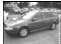
Škoda Octavia 1,9 TDI r.v. 2003, cena 319.000 Kč aut. klima, 2x airbag, ASR, ABS, CD, el. okna, posil., stf. nosič, centrá dálk., tón. skla, otáčk., vyhř. zrc