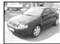
Audi A3 1,9 diesel r.v. 2000, cena 286.000 Kč aut. klima, 8x airbag, ESP, ABS, CD, centrá, el. př. okna, posil., počítač, alu kola, tón. skla