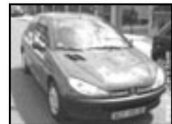
Peugeot 206 1,1i VAN r.v. 2001, cena 95.000 Kč airbag řidiče, orig. rádio, imobilizér, el. př. okna, posil, centrá dálkový