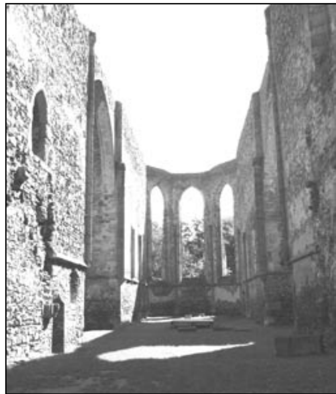
Presbyterium kostela - současný stav

Po nástupu nového probošta Martina Göschla, v roce 1517, nastal velký úpadek kláštera. Probošt