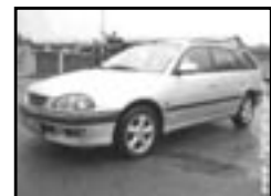
Toyota Avensis combi D4D r.v. 2000, cena 170.000 Kč klima, 4x airbag, ABS, posil., alu kola, centrá dálkový, otáčk.