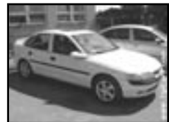
Opel Vectra 2,0 TD r.v. 1997, cena 109.000 Kč nafta, airbag řidiče, orig. rádio, střešní šibr man., posil., alu kola, centrá dálkový, mlhovky