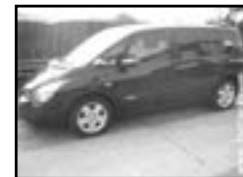
Renault Espace 2,2 DCI r.v. 1999, cena 479.000 Kč aut. klima, 8x airbag, xenony, ESP, ASR, EDS, ABS, CD, kúže, centrá, alarm, poč., alu kola, max. el. výbava