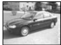
Ford Mondeo 2,5i GHIA r.v. 1999, cena 129.000 Kč klima, 2x airbag, ABS, orig. rádio, el. okna, posil., alu kola, centrá dálk., tón. skla, otáčk., el. zrc.