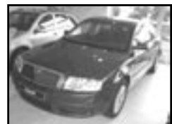
Škoda Superb 2,0 TDI r.v. 2006, cena 675.000 Kč aut. klima, 6x airbag, xenony, ESP, ASR, EDS, ABS, počítač, alu kola, centrá dálk., mlhovky