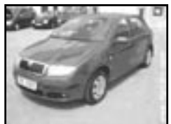
Škoda Fabia 1,2 HTP r.v. 2006, cena 230.000 Kč tach. 2 700 km, 2x airbag, ABS, centrá, imobil., el. okna, posil., tón. skla, otáčkoměr, mlhovky