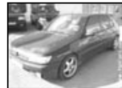
Peugeot 306 1,6i r.v. 1996, cena 65.000 Kč benzín, stav velmi dobrý, airbag řidiče, orig. rádio, el. okna, střešní šibr el., posil., alu kola, centrá