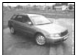
Audi A4 Avant 1,9 TDI r.v. 1997, cena 125.000 Kč aut. klima, 4x airbag, ABS, CD, imobil., posil., alu kola, tažné, centrá dálk., tón. skla, vyhř. zrc.