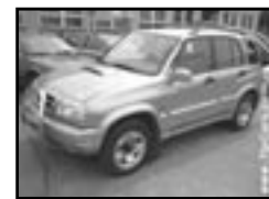
Suzuki Grand Vitara 2,0 TD r.v. 1999, cena 255.000 Kč 2x airbag, centrá, el. okna, posil., 4x4, stf. nosič, tažné, tón. skla, otáčkoměr, el. zrcátka