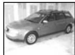
Audi A6 Avant 2,5 TDI r.v. 1999, cena 299.000 Kč aut. klima, aut. převod., 4x airbag, ASR, ABS, alarm, počítač, centrá dálk., tón. skla, vyhř. zrc, temp.