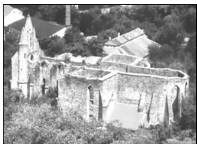
Celkový pohled na zříceninu kláštera

Opuštěného kláštera s celým panstvím se ujaly v roce 1527 Moravské zemské stavy, které jej předaly českému králi Ferdinandu I. Habsburskému. Ferdinand nejprve zastavil a nakonec roku 1537 prodal Jiřímu Žabkovi