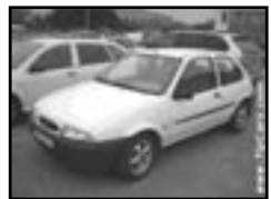
Ford Fiesta 1,8 diesel r.v. 1997, cena 59.000 Kč nafta, stav dobrý, servisní knížka, rádio, posilovač řízení, alu kola, centrá dálkový