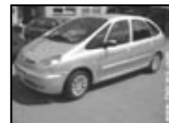
Citroen Xsara Picasso 2,0 r.v. 2003, cena 279.000 Kč HDI, nafta, aut. klima, 4x airbag, ESP, ABS, CD, el. okna, počítač, multif. volant, alu kola, temp.