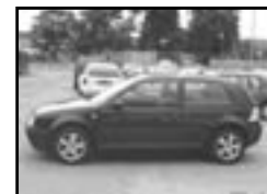
VW Golf 1,4 16V klima r.v. 1999, cena 179.000 Kč klima, 4x airbag, ABS, CD, centrá, el. okna, posil., alu kola, tón. skla, vyhř. el. zrc., mlhovky