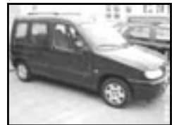
Citroen Berlingo 1,6 16V r.v. 2001, cena 185.000 Kč klima, 2x airbag, centrá, el. př. okna, posil., tón. skla, CD měnič, otáčkoměr, el. zrc.