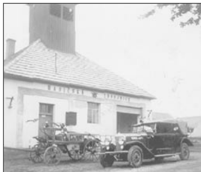
Svěcení zbrojnice 30. srpna 1936

Byla to slavnost nejen pro Němčice. Z okolních měst a vesnic přijely hasičské sbory a četní hosté. Slavnostní průvod vyšel v 9,15 hod. od kaple a zamířil nejprve k Ivančicím. U nádraží se setkal s farníky z Ivančic a opět