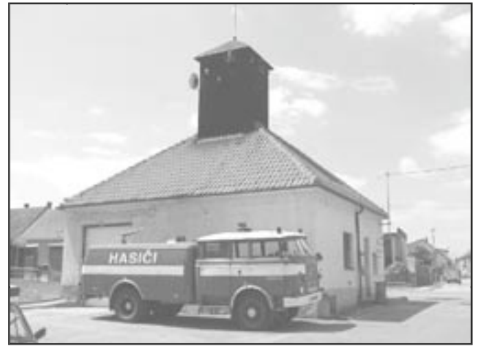
Hasičská zbrojnice v Němčicích, květen 2005

Akceschopnost sboru byla vážně ohrožena v roce 1959 vyřazením vozidla pro technickou nezpůsobilost. Na 33. výroční schůzi v prosinci 1960 přišlo jen 16 členů. Jejich vydané prohlášení jasně dokládá tehdejší postoj: „Jsme přesvědčeni, že až dostaneme to, co nutně potřebujeme, znovu naše jednotka vzroste“. Po třiletém čekání se podařilo zís-