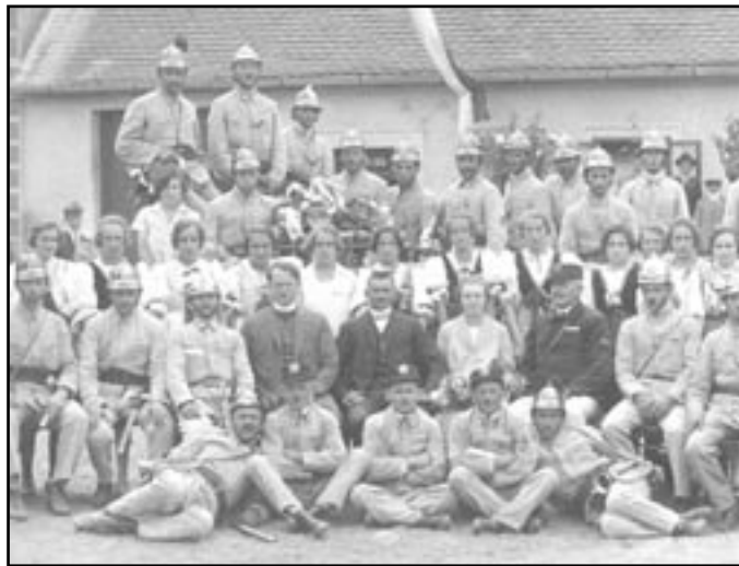
Svěcení stříkačky 6. září 1926

S rozvojem průmyslových závodů Ivančicích a okolí, s vybavením domácností i používáním nových materiálů včetně plastických hmot bylo třeba vybavit jednotku moderním zařízením umožňující hasební zásahy v podmínkách tak odlišných od doby založení sboru. Dnes už má sbor několik dýchacích přístrojů, agregát, dvě vozidla (jedno z nich je autocisterna), takže základní vybavení je k dispozici. Městský