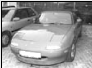
Mazda MX5, 1,6i, cabrio r.v. 1995, cena 100.000 Kč el. okna, centráľ, ABS, servo