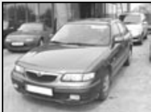
Mazda 626 modely od roku 1994 do 2000 ceny od 40.000 Kč pětidvéřové i kombi

Dobelice 52, tel.: 515 320 020 736 625 252 - prodej 604 614 678 - servis 777 666 626 - prodej a odtahová služba www.home.tiscali.cz/mazda