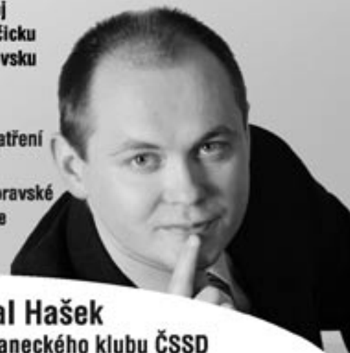
Mgr. Michal Hašek předseda Poslaneckého klubu ČSSD Parlamentu ČR