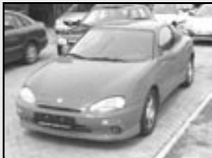
Mazda MX3 1,8i r.v. 1995, cena 85.000 Kč el. okna, servo, centráľ, alu kola