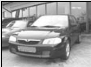
Mazda 323 modely od roku 1992 do 2000 ceny od 49.000 Kč