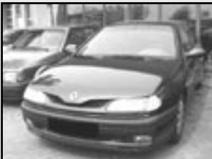
Renault Laguna 2,2 D r.v. 1995, cena 69.000 Kč el. okna, servo, ABS, airbag