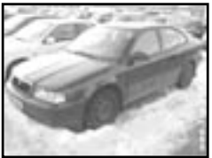
Škoda Octavia 1,9 TDI r.v. 1998, cena 155.000 Kč 2x airbag, ABS, rádio, alarm, el. zrc., centrální. dálkový., tón. skla