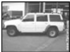
Nissan Patrol 2,9 TD r.v. 1984, cena 219.000 Kč 7 míst, centrální, el. okna a zrc., posil., ochranné rámy, tažné