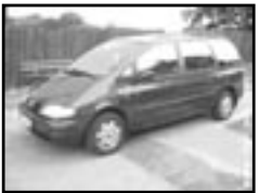
VW Sharan 1,9 TDI r.v. 1997, cena 209.000 Kč klima, 2x airbag, ABS, el. př. okna, tažné, vyhř. el. zrc. rádio