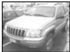
Jeep Grand Cherokee 3,1 r.v. 2001, cena 465.000 Kč aut. klima a přev., 2x airbag, ABS, kůže, 4x4, alu kola, centrální dálk.