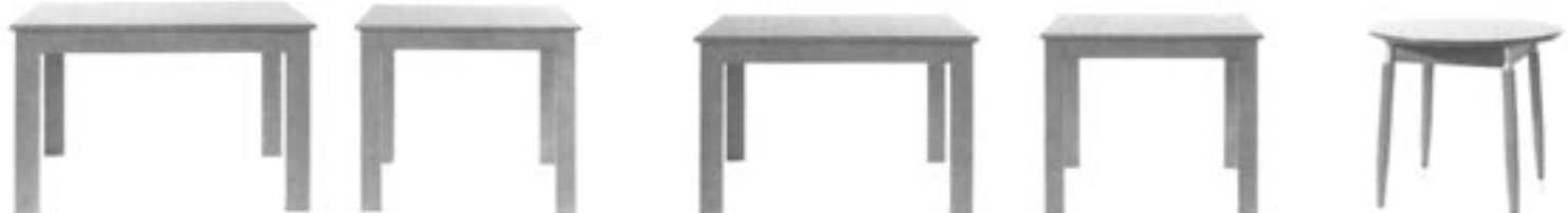
Jídelní souprava „CTIRAD“ za 3.500,- Kč