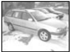
Toyota Avensis 2,0 TD r.v. 2000, cena 199.000 Kč combi, klima, 4x airbag, ABS, alu kola, posil., centrální dálkový