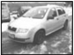
Škoda Fabia 1,4i r.v. 2002, cena 149.000 Kč airbag řidiče, rádio, centrální, imo- bilizér, posilovač, servis. knížka