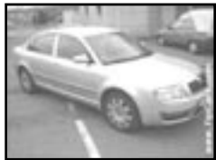
Škoda Superb 2,8 r.v. 2002, cena 419.000 Kč aut. klima a přev., 6x airbag, ABS, alu kola, maxim. el. výbava