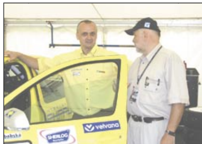
➔ V týmu Kawasaki Racing mají opravdu zajímavé zákulisi.