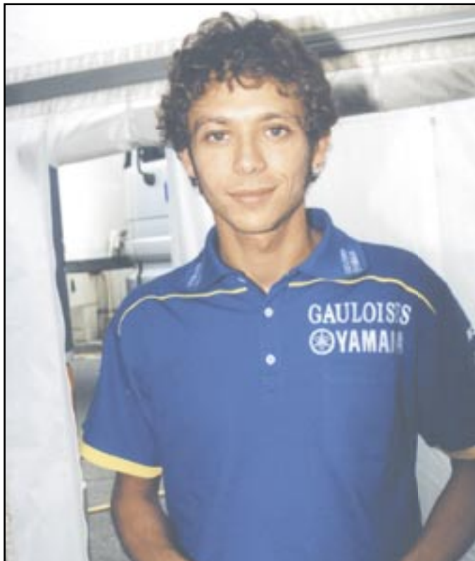
➎ Italský fenomén Valentino Rossi získal již sedmý titul mistra světa v silničních závodech motocyklů.