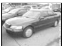
Honda Legend 3,5i r.v. 1997, cena 145.000 Kč klima, 2x airbag, ABS, kůže, orig. rádio, el. okna a zrc., posilovač