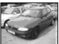
Opel Astra 1,6i r.v. 1999, cena 99.000 Kč zelená met., dobrý stav, rádio, centrální. zámeč, 55 kW