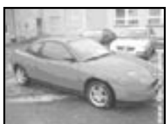
Fiat Coupé 1,8i klima r.v. 1997, cena 113.000 Kč klima, airbag řidiče, el. př. okna, posilovač, centrální dálk., dobrý stav