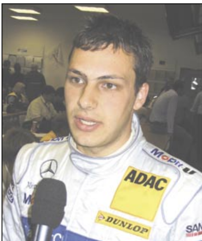
➏ Vítězem šampionátu DTM, jehož jeden závod se jel na Masarykově okruhu, se stal Gary Paffett z Velké Británie.