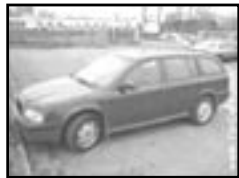
Škoda Octavia combi 1,9 r.v. 2000, cena 159.000 Kč 2x airbag, ABS, rádio, alarm, posil., počítač, tažné, centrální dálk.