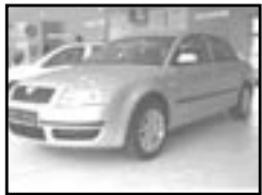
Škoda Superb 2,8 r.v. 2004, cena 499.000 Kč aut. klima a přev., 6x airbag, ABS, alu kola, el. zrc. a okna, centrální