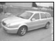
Lancia Lybra 1,9 JTD r.v. 2000, cena 219.000 Kč aut. klima, 4x airbag, ABS, el. zrc. a okna, počítač, alu kola, centrální