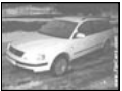
VW Passat variant 1,9 r.v. 2000, cena 230.000 Kč aut. klima, 4x airbag, ABS, el. zrc. a okna, tažné, centrální, tón. skla