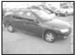
Peugeot 306 combi 1,9 TD r.v. 1998, cena 128.000 Kč klima, 4x airbag, rádio, centrální, el. před. okna, posil. říz., otáčkoměr