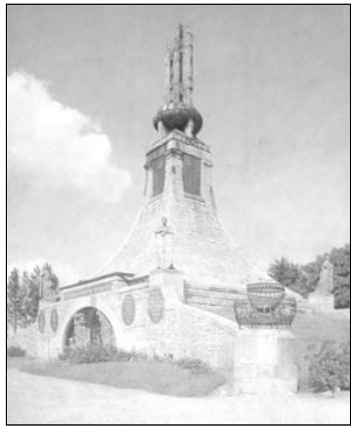
Mohyla míru - památník bitvy u Slavkova

Válka skončila, vítězná francouzská vojska postupně odcházela v Moravy. V okolí místa bitvy zůstala zpusťovaná krajina s hromadnými hroby. V Brně a dalších místech zůstaly tisíce raněných, z nichž velká část zemřela na