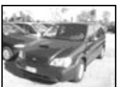
Kia Carnival 2,9 TDI r.v. 2002, cena 260.000 Kč aut. klima, 2x airbag, ABS, imob., centrální dálk., el. zrc., rádio