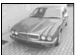
Jaguar Dimler SIX 4,0i r.v. 1997, cena 229.000 Kč aut. klima a přev., 2x airbag, ASR, ABS, kůže, počítač, výbava v el.