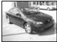
Opel Astra 1,8i 16V r.v. 2000, cena 179.000 Kč Cupé, klima, 4x airbag, ABS, el. okna, alu kola, centrální dálk.