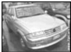
Ssang Yong Musso 2,9 D r.v. 1999, cena 199.000 Kč klima, airbag řidiče, ABS, rádio, centrální, el. okna, 4x4, alu kola