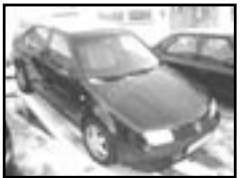
VW Bora 1,9 TDI r.v. 2000, cena 259.000 Kč aut. klima a přev., 2x airbag, ABS, alarm, al. okna a zrc., alu kola