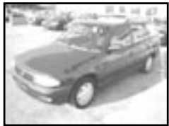
Opel Astra combi 1,6 r.v. 1997, cena 99.000 Kč 2x airbag, rádio, centrální, el. šibr, posilovač, tažné, CD měnič