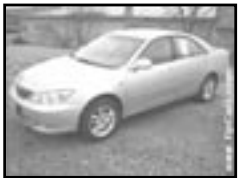
Toyota Camry 2,4i r.v. 2002, cena 450.000 Kč aut. klima, 4x airbag, ABS, CD, el. okna a zrc., počítač, alu kola