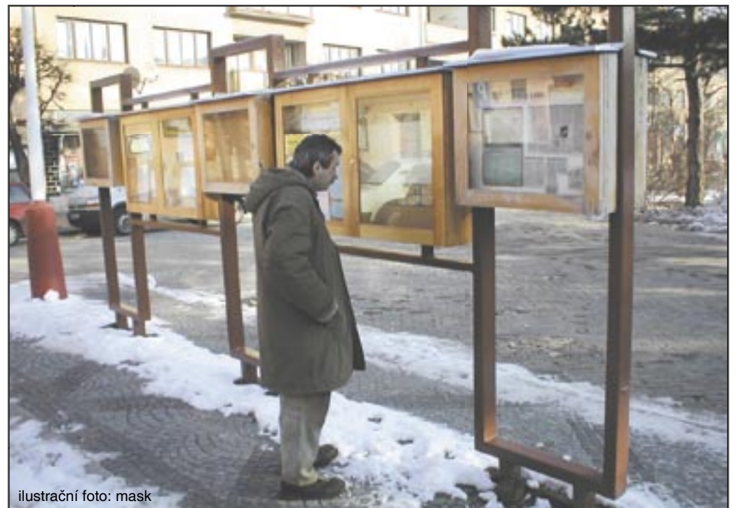
ilustrační foto: mask

„My jsme dali elektronickou úřední desku na naši webovou