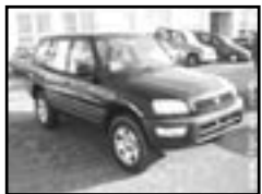
Toyota Rav 4 2,0i r.v. 1999, cena 239.000 Kč klima, 2x airbag, ABS, rádio, el. okna, 4x4, alu kola, centrální, el. zrc.