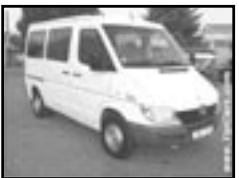
Mercedes Benz Sprinter r.v. 2000, cena 335.000 Kč 2,2 CDI, minibus, 9 míst, airbag řidiče, tažné, centrální, orig. rádio