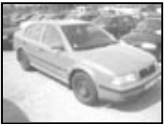
Škoda Octavia 1,9 TDI r.v. 1999, cena 159.000 Kč airbag řidiče, rádio, centrální, imo- bilizér, posil., počítač, el. zrc.