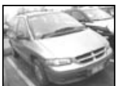
Chrysler Voyager 2,0i r.v. 1997, cena 145.000 Kč klima, el. okna a zrc., posil., střední nosič, centrální dálk., orig. rádio