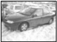
Renault Laguna 2,0i r.v. 1994, cena 49.000 Kč aut. klima, airbag řidiče, ABS, rádio, el. okna a zrc., posilovač