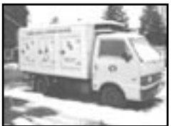
Mazda E 2200 mrazák r.v. 1997, cena 90.000 Kč cena bez DPH, dobrý stav, kou- peno v CZ, užitkové vozidlo