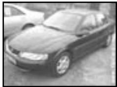
Opel Vectra 1,8 16V r.v. 2001, cena 175.000 Kč klima, 4x airbag, orig. rádio, el. okna a zrc., centrální dálkový