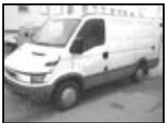
Iveco Daily 2,8 D r.v. 2001, cena 299.000 Kč cena bez DPH, klima, rádio, vyhř. zrc., centrální, posil., servis. knížka