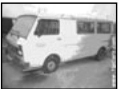
VW LT 28 2,4D mikrobus r.v. 1992, cena 45.000 Kč dobrý stav, posilovač řízení, tažné, koupeno v D