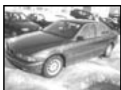
BMW 525 TDS r.v. 1999, cena 265.000 Kč aut. klima, 6x airbag, xenony, ABS, el. okna, počítač, alu kola, el. zrc.

telefon a fax: 546 452 948 mobil: 602 526 745 606 385 292, 602 536 741 e-mail: avtom@volny.cz www.tipcars.com/cz/laucar