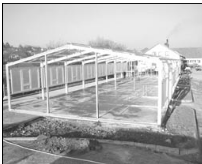
Stavba truhlářské haly v Polánce - listopad 2005.

SOŠ a SOU v Moravském Krumlově patří v našem regionu ke školám nejen s dlouholetou tradicí, ale i s vysokou prestiží. Aby se tento trend udržel, snaží se management školy pro své žáky i zaměstnance vytvářet co nejlepší podmínky ke studiu a práci. V současné době zde studuje 624 žáků a studentů.