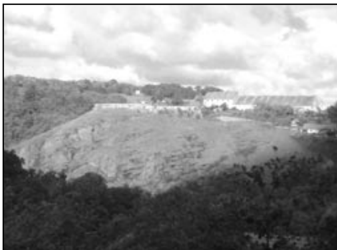
Hradiště Budkovic I. - pohled na skálu se zbytky tvrže a dvora

V katastru Budkovic byly dosud nalezeny tři lokality tohoto typu, což je koncentrace zcela neobvyklá. Příčinou je jistě velká členitost terénu v údolí Rokytne, která nabídla obyvatelům tohoto kraje dostatek vhodných míst.