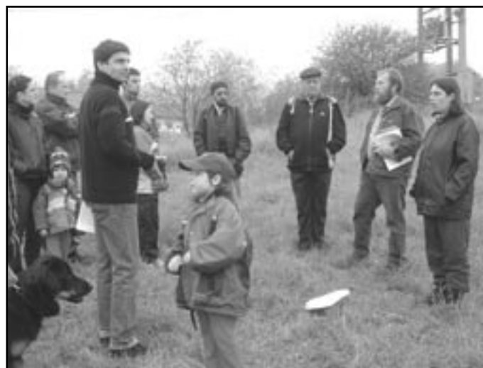
Odborný výklad na hradišti Budkovic I.

odborníků nám, doufám, pomohou pochopit mezioborové souvislosti. Doufáme také, že při osobním setkání s vámi – místními znalci – získáme nové náměty pro naše expedice.