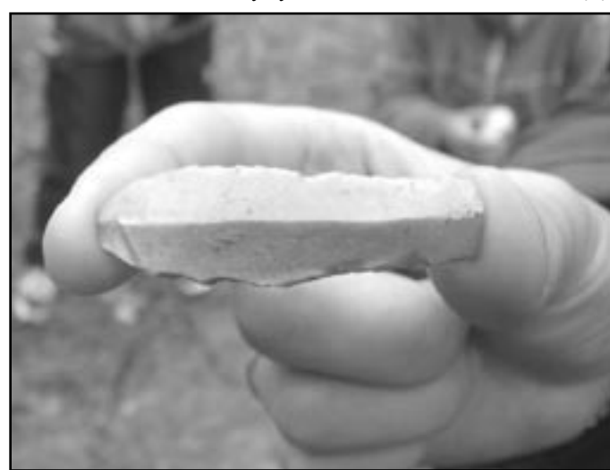
„Pravěký nůž“ - čepelka štípaná z rohovce nalezená na exkurzi

Významný vliv také mělo velmi intenzivní osídlení budkovického katastru v různých obdobích pravěku. Zde je třeba zdůraznit, že každé ze tří dosud poznanych hradišť má pravděpodobně těžiště osídlení v různé době. Aby byl