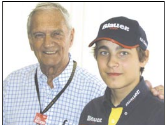
Legenda a mláď - Jim Redman s Karlem Abrahámem

jezdil na třetím místě za Rossim a Gibernauem. V nájezdu do posledního okruhu zavelel Rossi k rozhodujícímu útoku a předjel Gibernaua. Vyvrcholení dramatické bitvy a sportovní tragédie přišla čtyři zatáčky před cílem závodu, když Gibernau pro poruchu svého motocyklu ze závodu odstoupil. Nejlepšího letošního výsledku dosáhl Capirossi s Ducati na druhém místě. Třetí místo získal Biaggi. Čtvrtý dojel Barros před Haydenem /všichni Honda/. Rossi /Yamaha/ zvítězil letos po deváté z jedenácti závodů a při příštím závodě v Japonsku mu stačí dojet na druhém místě k získání již sedmého titulu světového šampióna.