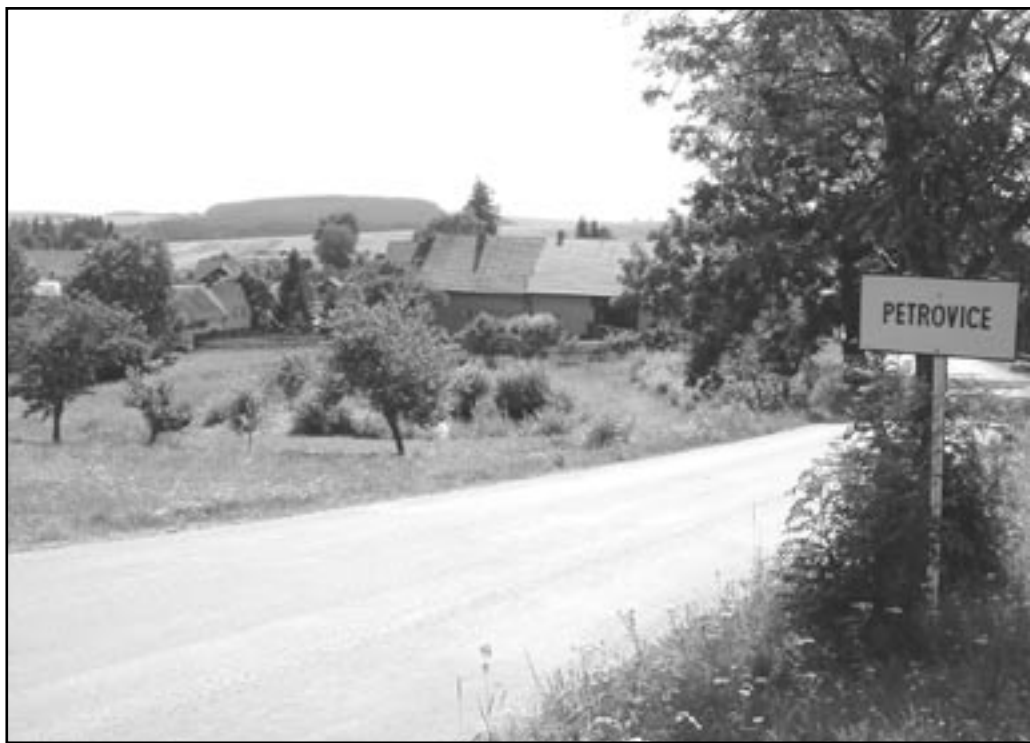
Petrovice u Nového Města na Moravě

Dnes se vydáme neobvykle daleko za hranice našeho regionu. V nejvyšších polohách Vysočiny můžeme nalézt i kousek historie Moravskokrumlovska.