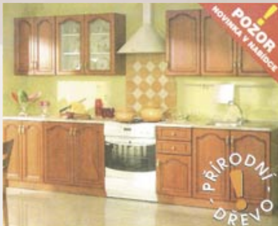
Nika Standard 260 Barva: oranžová olše šířka 260 cm dřevěná dvířka 14.860,-

Zastupujeme cestovní kanceláře z celé ČR s pojištěním proti úpadku. Čedok • Sunny Days • Exim Tours • Firo tour • Alexandria • Intertrans • Čebus • Victoria • Atis • VOMA • Ancora • Mega Travel • Bohemian Fantasy • Ingtours • Tipa tour • Viamare • Hellas tour • Cílka • B&K tour • Galatea • autobusové jízdenky od společnosti Student agency • letenky do celého světa od letecké společnosti ČSA