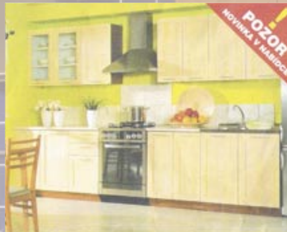
8.940,- Nika Standard 260 Barva: javor nida šířka 260 cm