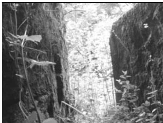
Úzká boční výpust náhonu na Vilímův mlýn

Z Přešovic se vydejte po polní cestě podél přešovického potoka směrem k lesu. Na okra-