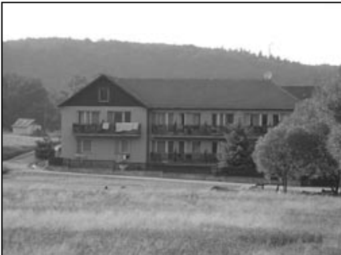
Vilímův mlýn stojí na místě původního Sovoluského mlýna

Dnes se vydáme do údolí řeky Rokytne mezi obce Tavíkovice a Přešovice, kde se uprostřed říčního údolí nachází kopec s názvem Cibuluška. Pokusíme se odhalit, co se skrývá pod tímto poetickým a trochu tajemným jménem.