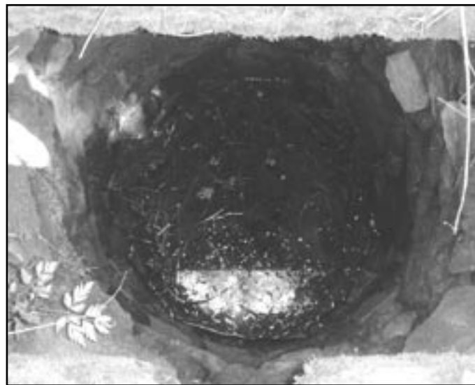
Studnu u bývalé hájovny vyhloubili pravděpodobně již habáni

Osada patrně pokračovala i po vyvrácení Velké Moravy, protože