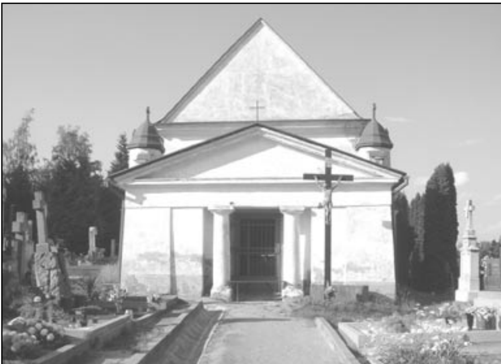
Hřbitovní kaple byla postavena ze zdiva zbořeného druhého bohutického kostela