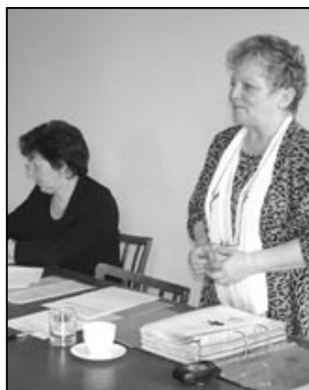
Ze zasedání mikroregionu

/Moravský Krumlov/ Mikroregion Moravskokrumlovsko nově zavedl službu konzultačních a poradenských dnů, které jsou určeny samosprávám mikroregionu, podnikatelům, organizacím, aktivním obyvatelům a dalším partnerům, kteří mají zájem aktivně spolupracovat na ožívování a rozvoji území regionu Moravskokrumlovsko. „Letos bude kancelář fungovat v prostorách městského úřadu v Moravském Krumlově. Je situována do přízemní