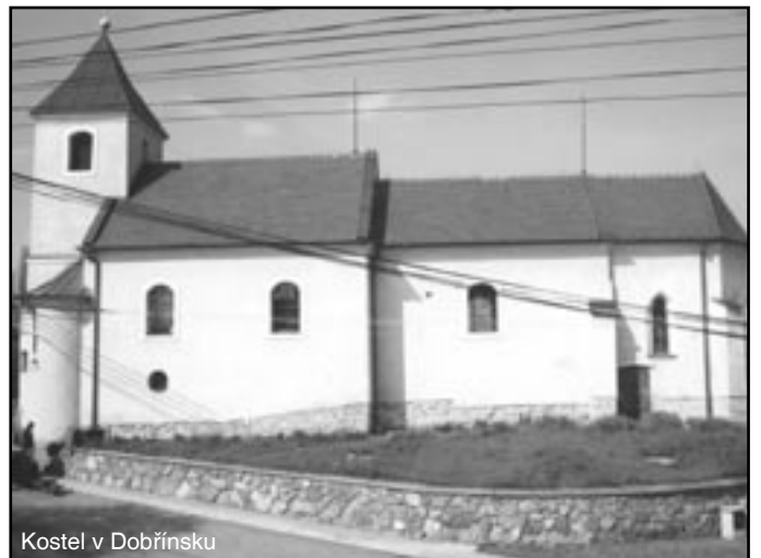
Kostel v Dobřínsku

V naší obci pořádají kulturní akce místní organizace SDH, TJ, Svaz žen, Myslivecké sdružení a také Obecní úřad. Jsou to především plesy a zábavy jako např. Sbor dobrovolných hasičů pořádá každým rokem „Ostatkovou zábavu“, která má v naší obci již dlouhou tradici. V loňském roce oslavili 100. výročí založení SDH. Při té příležitosti proběhla velká oslava na místním hřišti. V letošním roce bychom Vás mohli pozvat na tradiční pouť, která se u nás koná každý rok na svátek sv. Prokopa. Letos bude 2. a 3. července spolu s pouťovou zábavou. Další organizace - Tělovýchovná jednota - mimo fotbalová utkání, která se na místním hřišti hrají pravidelně, pořádá k svátku dětí Dětské odpoledne, vyplněné různými hrami a soutěžemi. Druhého července pro-