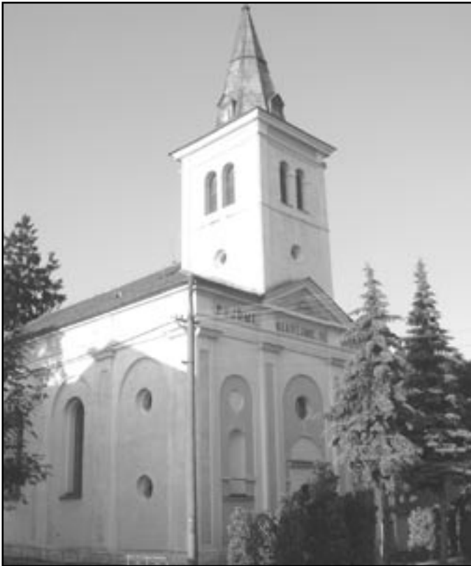
Třetí (současný) bohutický kostel

Vinorodé svahy v okolí kopce Leskouna patří k nejdéle obydleným místům našeho kraje. Velmi teplá poloha, úrodná půda a daleký rozhled do krajiny Dyjsko-svrateckého úvalu po tisíciletí lákaly k usazení lidí různých pravěkých kultur včetně našich slovanských předků.