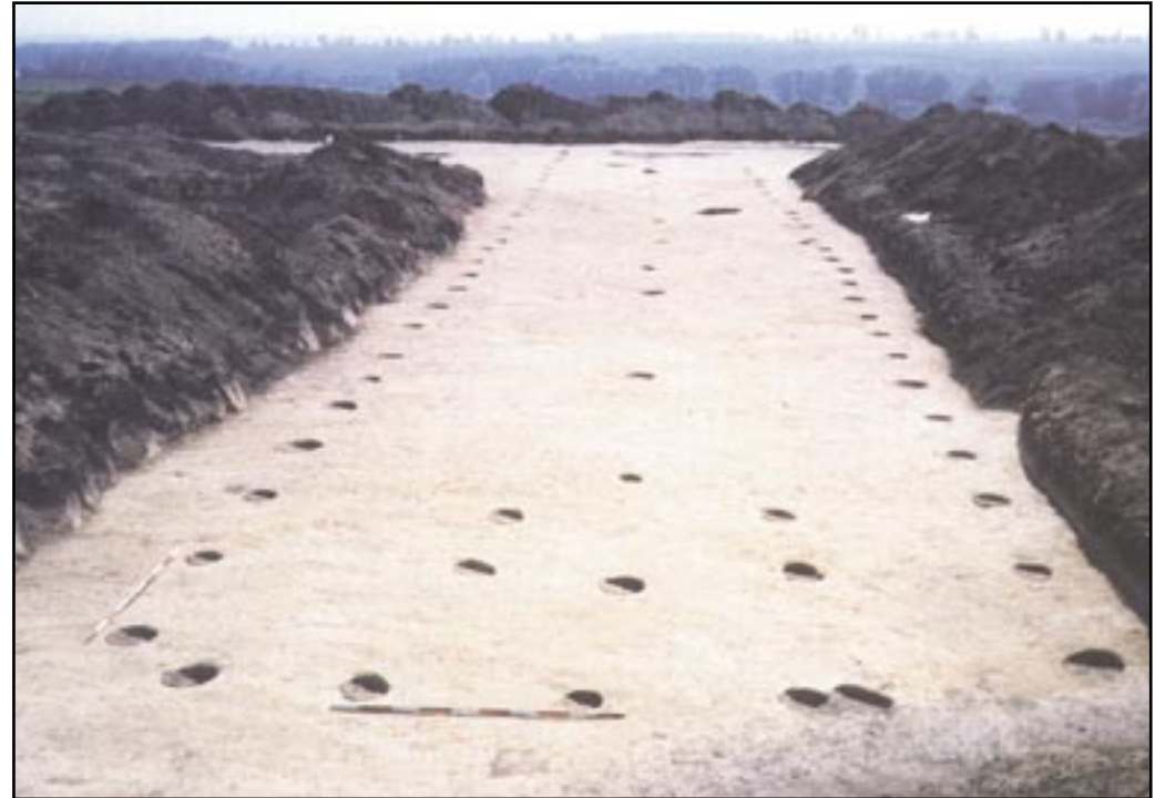
Fotografie z doby výzkumu šumického rondelu. V řadách jsou zřetelné jámy po kulech nadzemní konstrukce halového domu.

Zájemcům o podrobnosti doporučujeme knihy V. Podborského a kol. vydané Ústavem archeologie a muzeologie FF MU Brno: • Pravěká sociokulturní architektura na Moravě. (1999) • 50 let