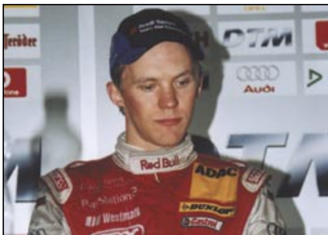
☛ Švéd Mattias Ekström /Audi/ si vítězstvím na Masarykově okruhu definitivně vybojoval titul šampiona DTM.