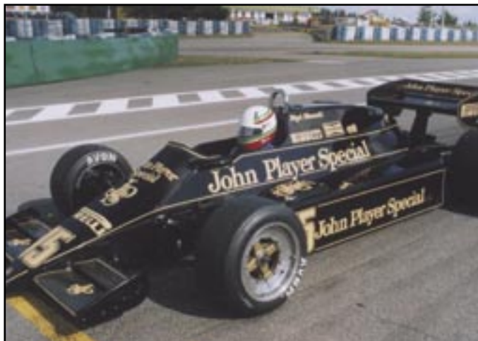
☛ V Brně se jel i závod historických vozů Formule 1. Na snímku je Lotus, se kterým v GP startoval Nigel Mansell.