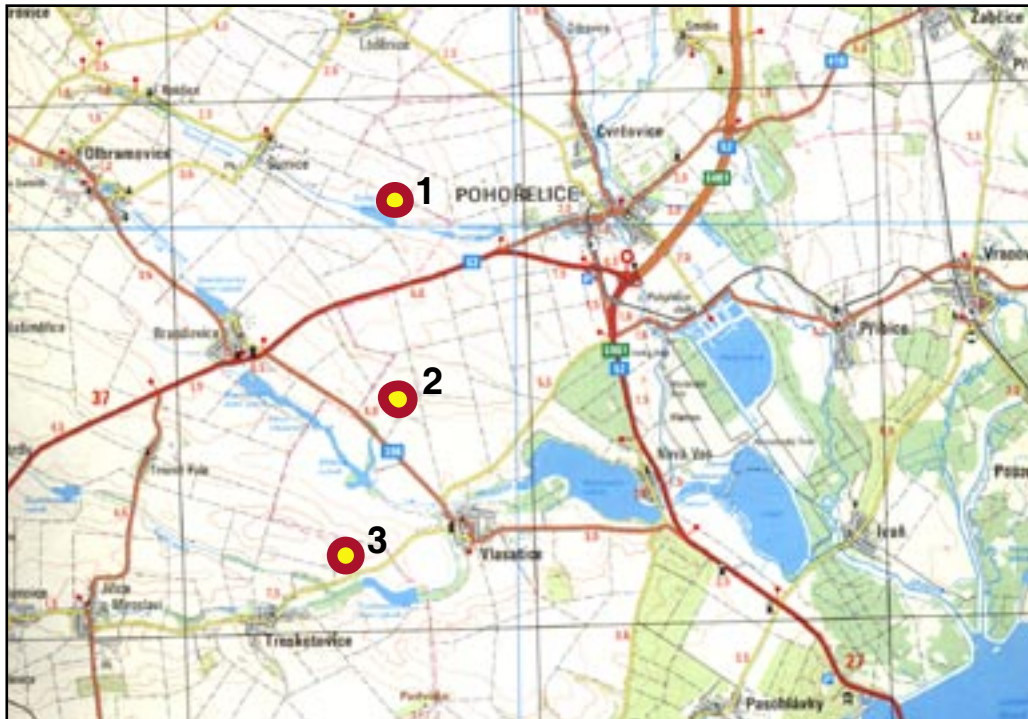
Mapka s vyznačením třech popisovaných rondelů: 1. šumický, 2. vlasatický, 3. troskotovický.

Mohli bychom začít ve stylu klasické pohádky: „Je obehnan příkopem, ale pevnost to není. Je tam dům, ale k bydlení není. Je tam hrob, ale obyčejný hřbitov to není. Co je to?“