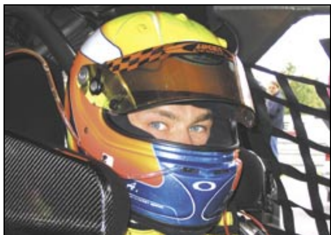
☛ Výkon svého syna ve Formuli 3000 při Jarní ceně Brna sledoval trojnásobný mistr světa F1 Niki Lauda.