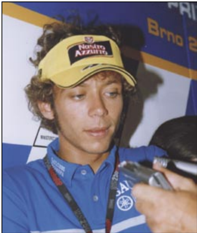
☛ I po přestupu od Hondy k Yamaze ukázal italský mladík Valentino Rossi, kdo je nyní nejlepším jezdcem planety a získal již šestý světový titul.