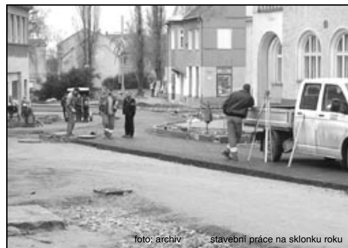
stavební práce na sklonku roku

/Miroslav/ Koncem roku byl předán do předčasného užívání první úsek nově rekonstruovaného silničního průtahu Miroslavi. Po více jak šesti měsících se tak