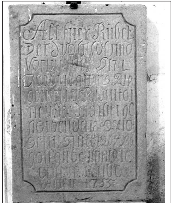
Jeden znáhrobní kámen v kapli, datován rokem 1755

Vraťme se ale k samotnému vzniku i zániku obce Topanova. První spolehlivá písemná zmínka o Topanově pochází až z roku 1358. Osada Topanov je vzpomínána ještě v 15. století. Pak se v pramenech o osadě vesměs mlčí a další