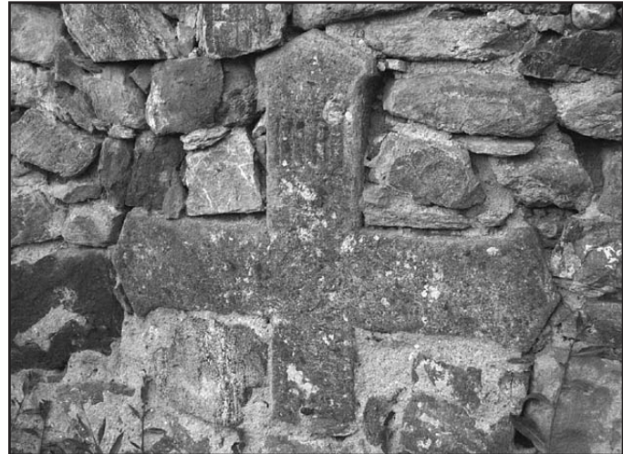
Kříž zazděný ve hřbitovní zdi