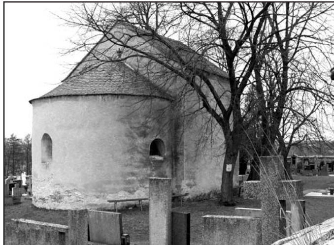
Současná podoba kaple sv. Markéty

byl z části zbořen a upraven na kapli současných rozměrů a zbývající kamení odvezeno. Zvony byly později umístěny v rybnickém kostele.