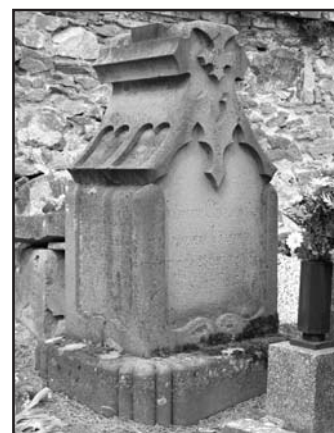
Jeden z nejstarších náhrobních kamenů na hřbitově v katastru obce Rybníky, patřící do již zaniklé vesnice Topanov.

Více o smířčích kamenech se dozvíte v připravovaném článku expedice SPECULUM. /mape/