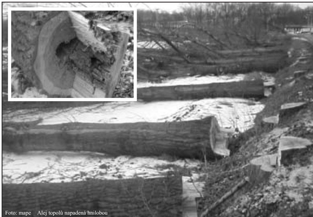
Foto: mapa Alej topolů napadená hnilobou