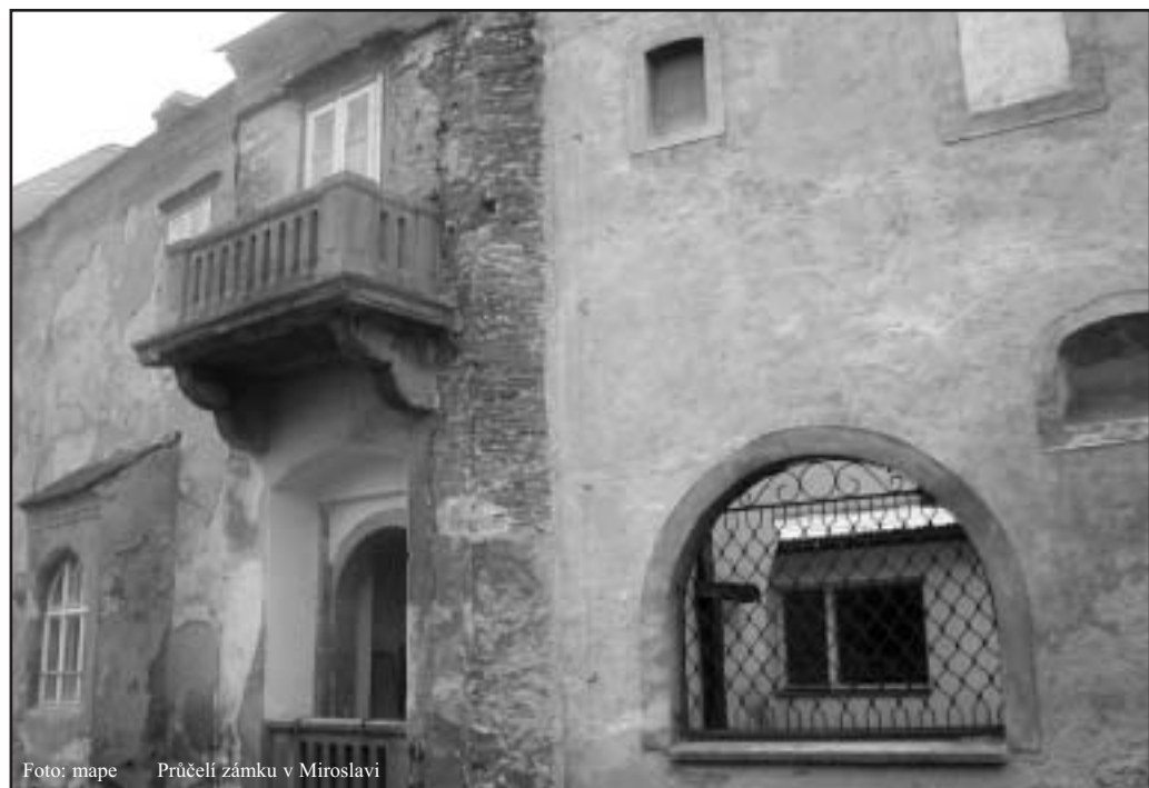
Průčelí zámku v Miroslavi

Zpětně to může vypadat už jako legrace, ale ve skutečnosti běží o riskantní situaci. Mnohde i v okolí tito chytráci uspěli a objekty do-