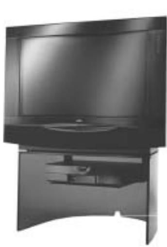
Accordia 9381 ZW