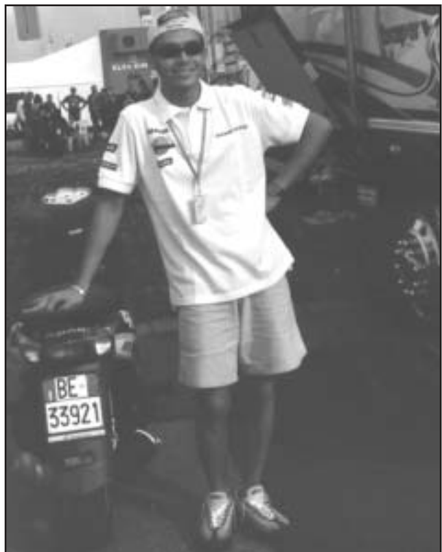
Valentino Rossi v plné parádě

a dvakrát bronzový. Třetí příčku obsadil Rosiho týmový kolega japonec Tohru Ukawa, který zvítězil jednou, dvakrát dojel na druhém místě a šestkrát byl třetí. Celkově čtvrtý je Brazilec