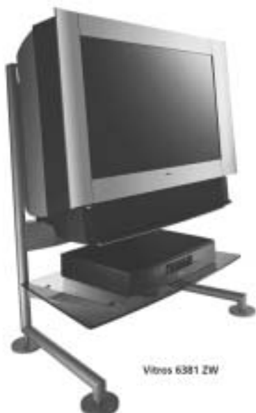
Vitros 6381 ZW

Palackého náměstí 43 Ivančice tel.: 546 436 359