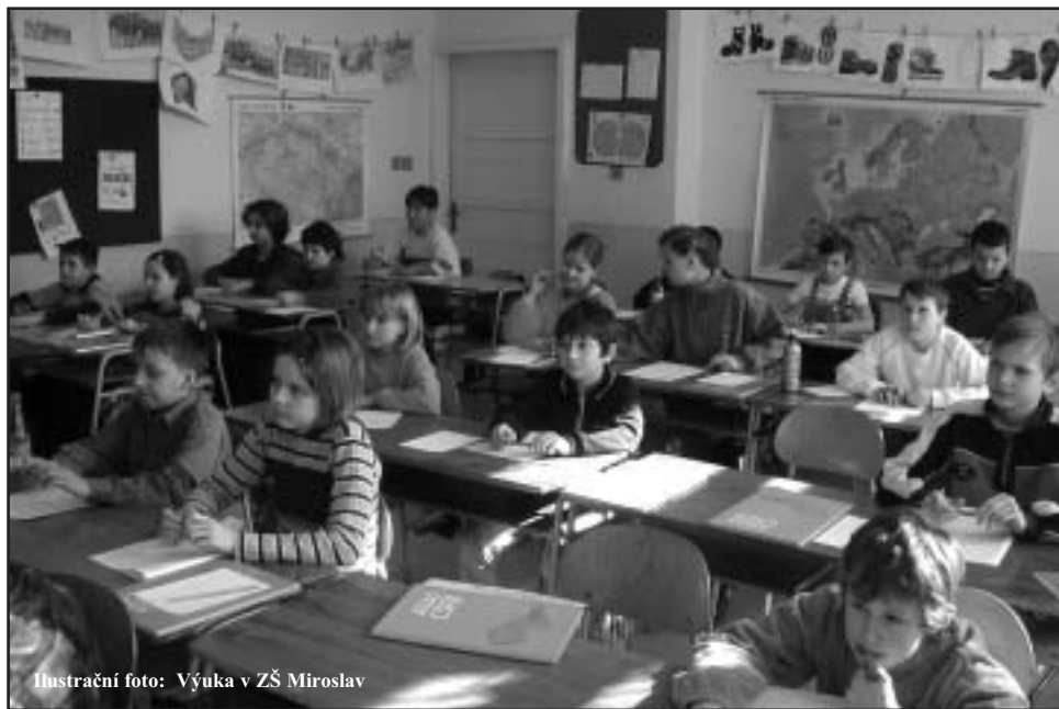
Ilustrační foto: Výuka v ZŠ Miroslav

Po obědě se všichni odebrali do Základní školy. Obec letos dokončovala teprve první etapu rekonstrukce školní budovy. Proběhla výměna oken a zateplení fasády, to jsou dva