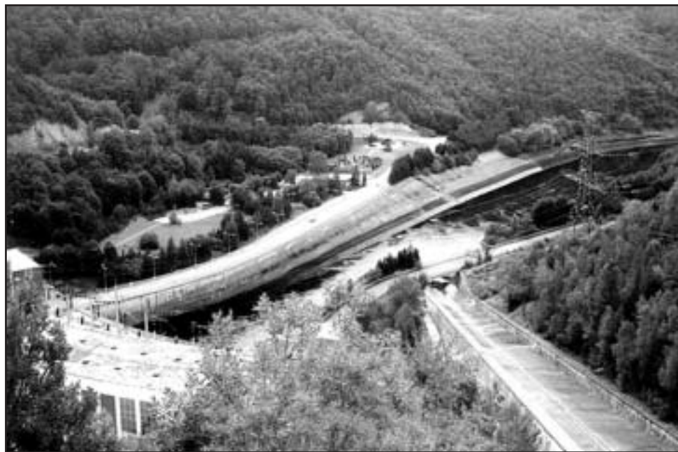
Ilustrační foto: Přečerpávací přehrada Dalešice

Do stejného půlstoletí nepokory spadá i výstavba dvojice přehrad Dalešice a Mohelno, které úzce souvisejí s provozem Jaderné elektrárny