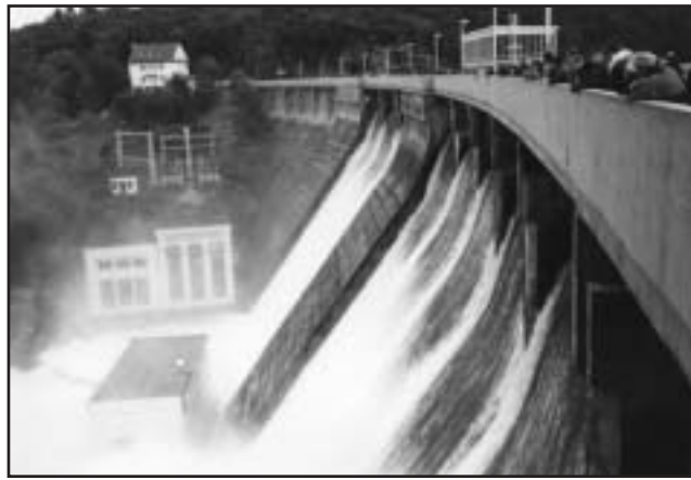
Vranovská přehrada - 14. srpna po rozednění

hladina se vyšplhala do metrové výšky v přepadech, kde už zbývalo posledních třicet centimetrů.